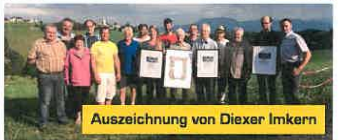
Auszeichnung von Diexer Imkern