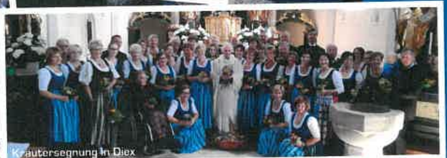
Krautersegnung in Diex