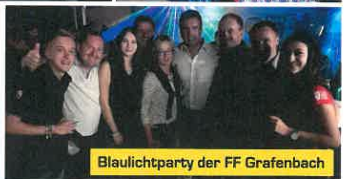
Blaulichtparty der FF Grafenbach