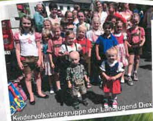
Kindervolkstanzgruppe der Landjugend Diex