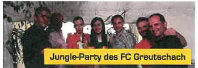
Jungle-Party des FC Greutschach