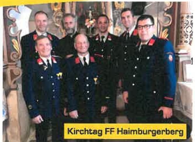
Kirchtag FF Haimburgerberg