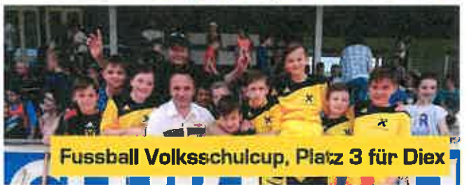
Fussball Volksschulcup, Platz 3 für Diex