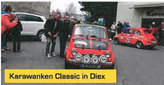
Karawanken Classic in Diex