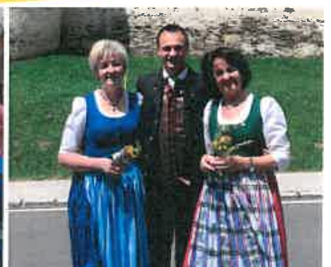
Präsentation Diexer Dirndl