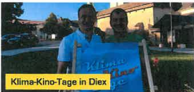
Klima-Kino-Tage in Diex