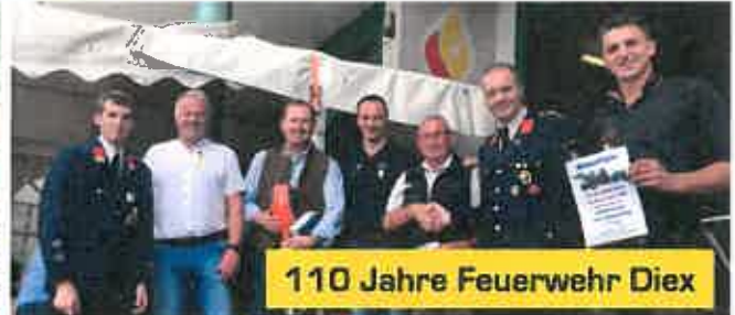
110 Jahre Feuerwehr Diex