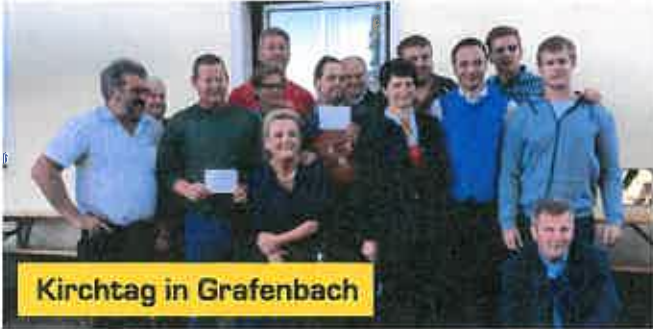
Kirchtag in Grafenbach