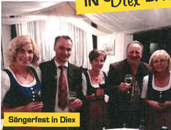
Sängerfest in Diex