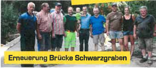
Erneuerung Brücke Schwarzgraben