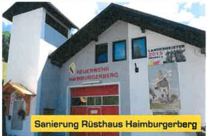
Sanierung Rüsthaus Haimburgerberg