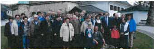
Seniorenbund Jagerberg zu Besuch in Diex