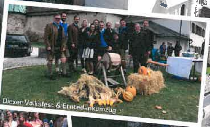
Diexer Volksfest & Erntedankumzug