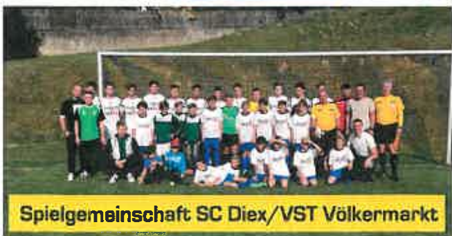
Spielgemeinschaft SC Diex/VST Völkermarkt