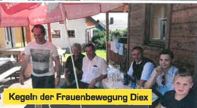
Kegeln der Frauenbewegung Diex