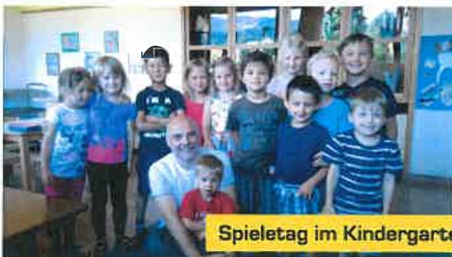
Spieltag im Kindergarten und der Volksschule Diex