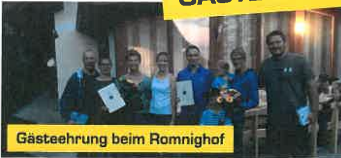
Gästeehrung beim Romnighof