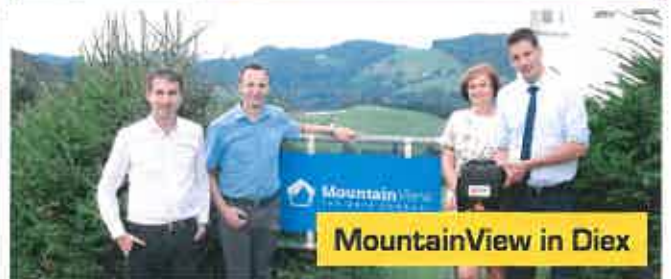
MountainView in Diex