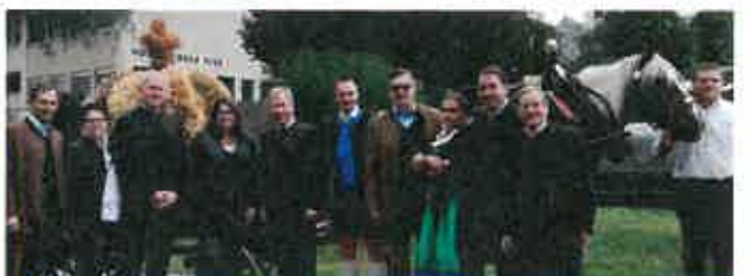
Jubiläum zum 45. Großen Diexer Volksfest mit Erntedankumzug