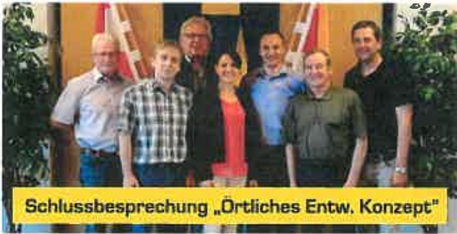
Schlussbesprechung „Örtliches Entw. Konzept“