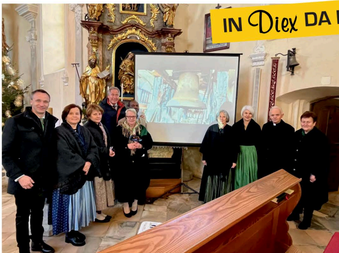
100 Jahre Martinglocke