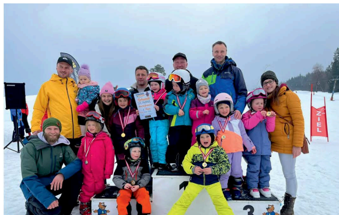
Kinderskikurs KiGa Diex