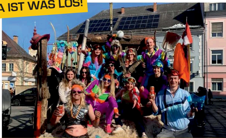
Landjugend Diex beim Faschingsumzug Völkermarkt