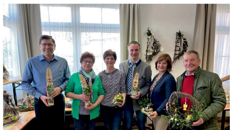
Osterbasar Pensionisten 51plus