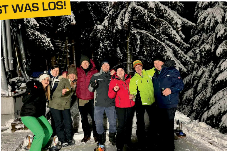
Eisstockturnier der LFD in Diex