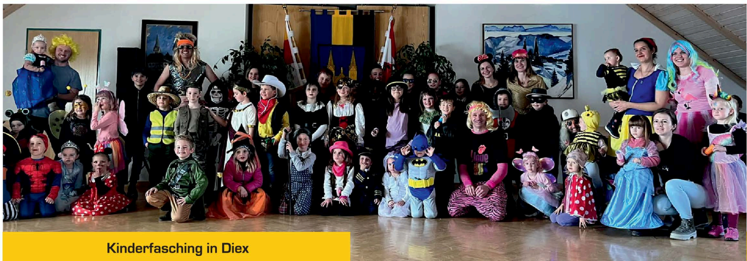
Kinderfasching in Diex