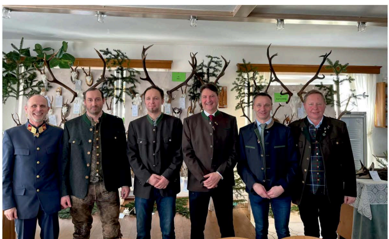
Hegeringschau in Diex