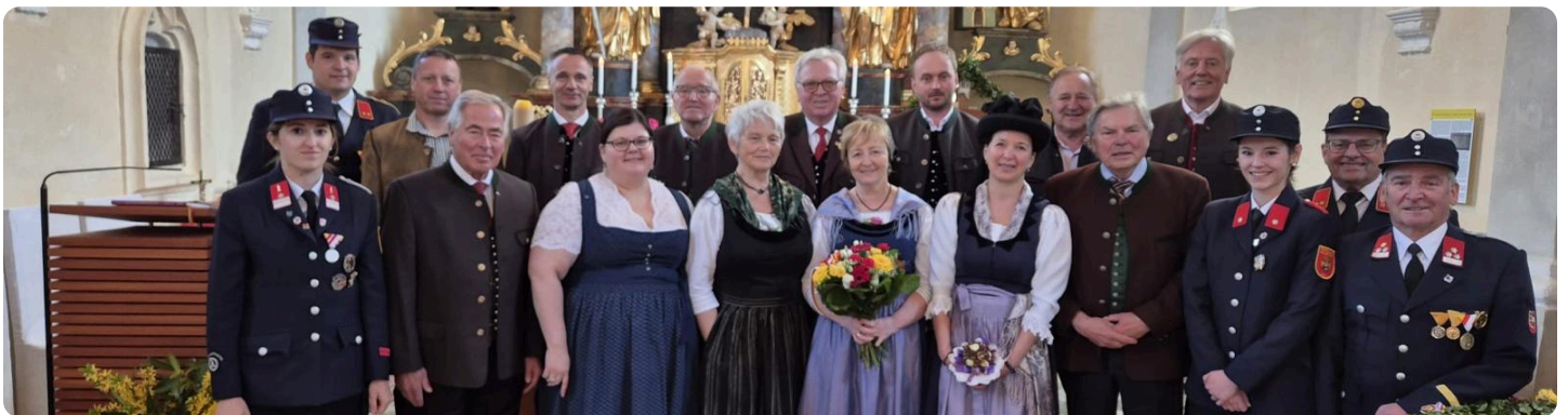
40-jähriges Jubiläum Trachtengruppe Diex