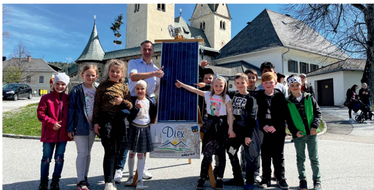
Tag der Sonne in Diex