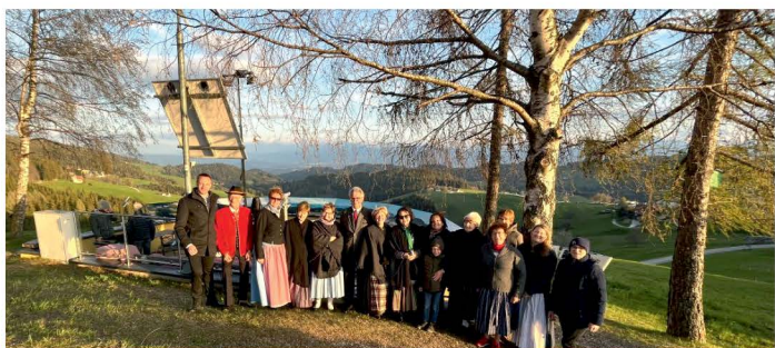
Jauntal über Berge verbunden