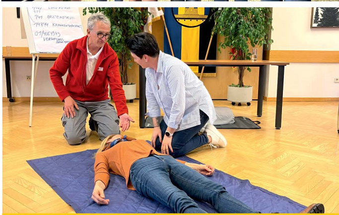
Erste Hilfe Kurs