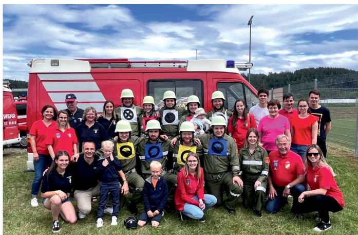
Landesmeisterschaft mit der Gruppe der FF Diex