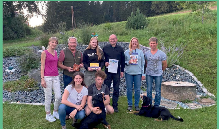
Gästeehrung Romnighof, 10 Jahre