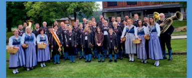
Musikalische Umrahmung durch den Musikverein Haimburg

Der Abwehrkämpferbund – Ortsgruppe Diex und die Gemeinde Diex freuen sich auf ein gemeinsames Gedenken.