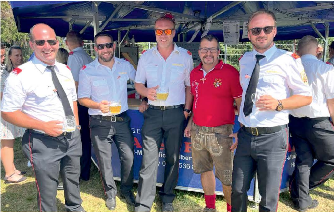
Feuerwehrfest FF Greutschach-Kaunz