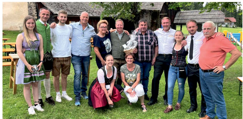
Grafenbacher Kirchtag GH Leitgeb