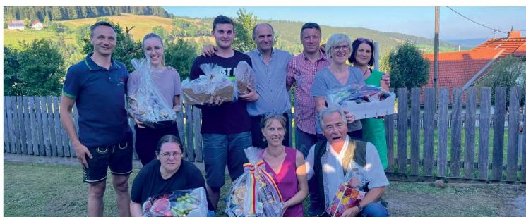
Kegeln Frauenbewegung Diex