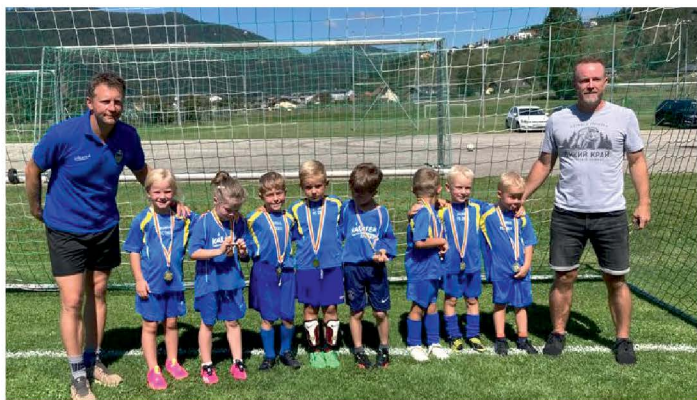
Kinderfußball SC Diex