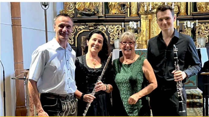
Flötenkonzert in Grafenbach