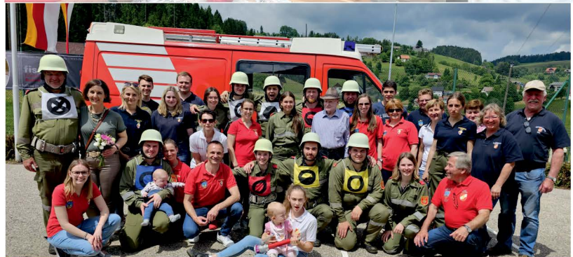
Bezirksmeisterschaft in Pustritz, FF Diex