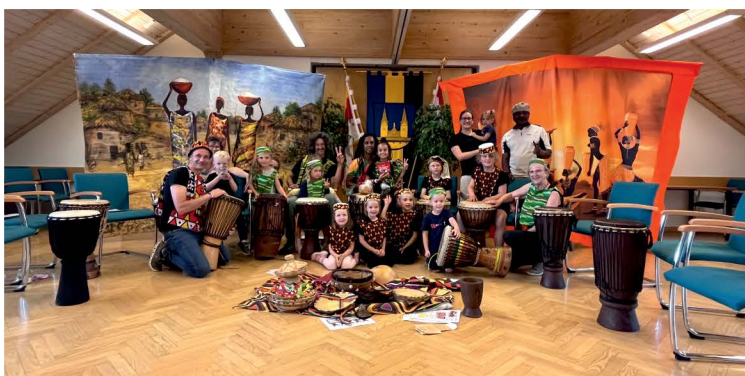
Trommelworkshop mit der Jungscher