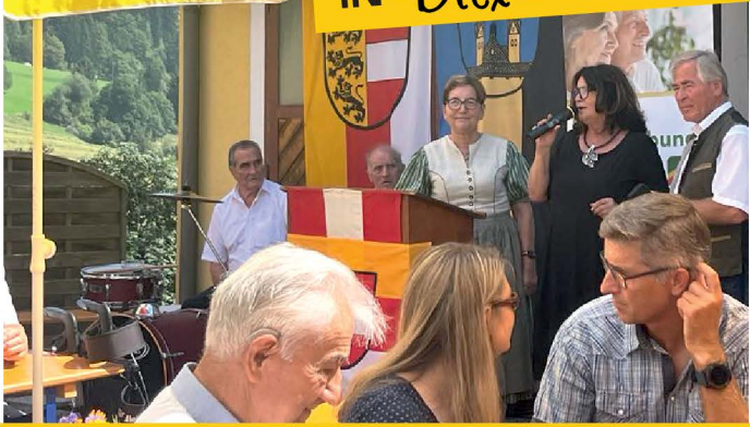
Backendfest der Senioren