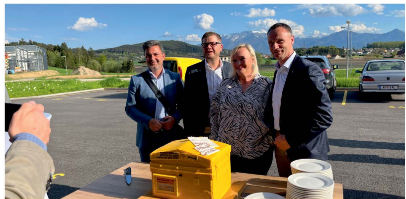
Eröffnung Postverteilerzentrum Völkermarkt