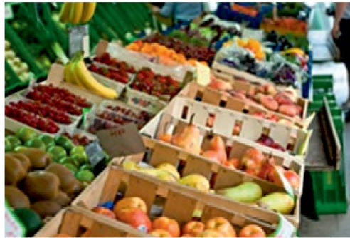
Obst und Gemüse ohne Verpackung

Viel zu viele Lebensmittel und andere Konsumprodukte sind in Plastik verpackt. Natürlich kann Plastik bis zu einem gewissen Grad recycelt werden – dazu muss es aber erst mal in die Gelbe Tonne/den Gelben Sack entsorgt werden, was allzu oft nicht passiert.