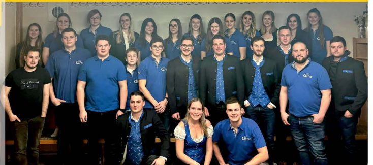
Jahreshauptversammlung der Landjugend Diex