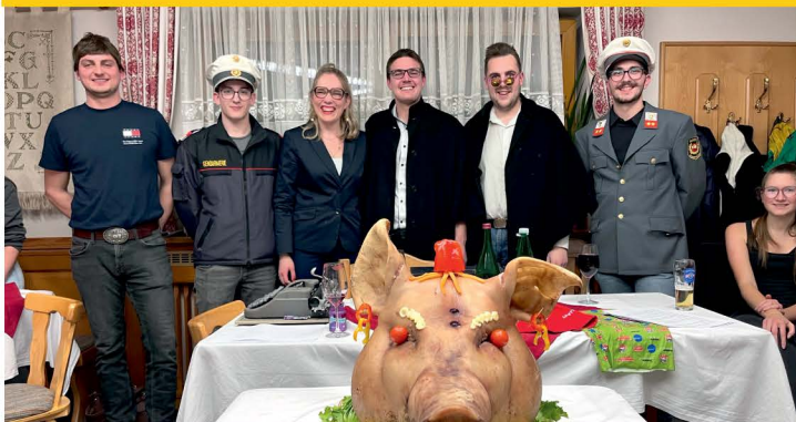
Sauschädelverhandlung der LJ Diex