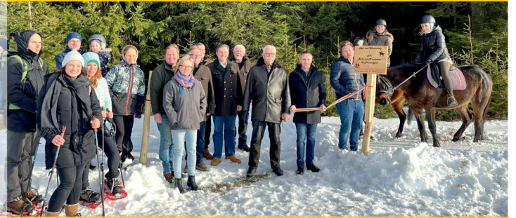
Eröffnung Reitweg Petschnighof