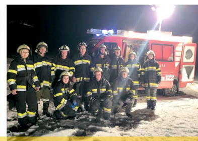
Übung FF Haimburgerberg