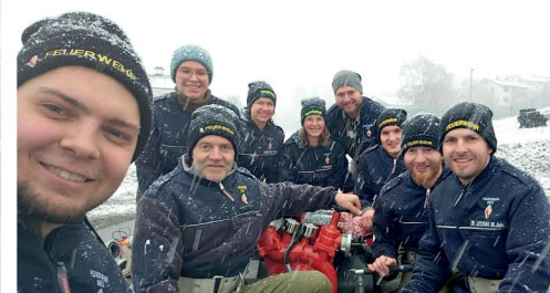
FF Diex beim Werbestraining