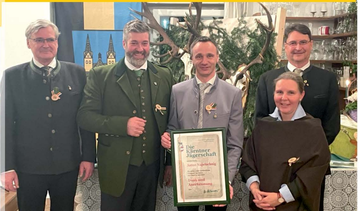
Bezirksjägertag im GH Leitgeb