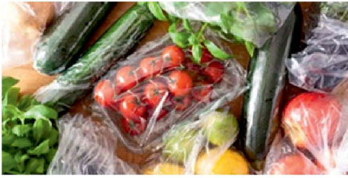
Unnötig verpacktes Obst und Gemüse