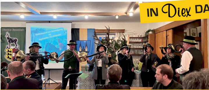
Bezirksjägertag mit der Jagdhornbläsergruppe „Plesshühner“ aus Diex