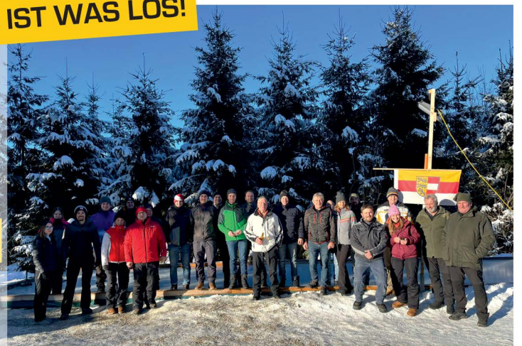
Eisstockturnier der LFD – Liste für Diex