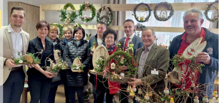
Osterbasar Penionisten 51plus